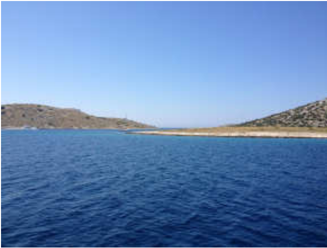
27.07 Ugljan Marina Sutomiscica