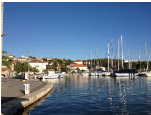
24.07 - 25.07 Kakan Potkucina Bucht "Babalu"